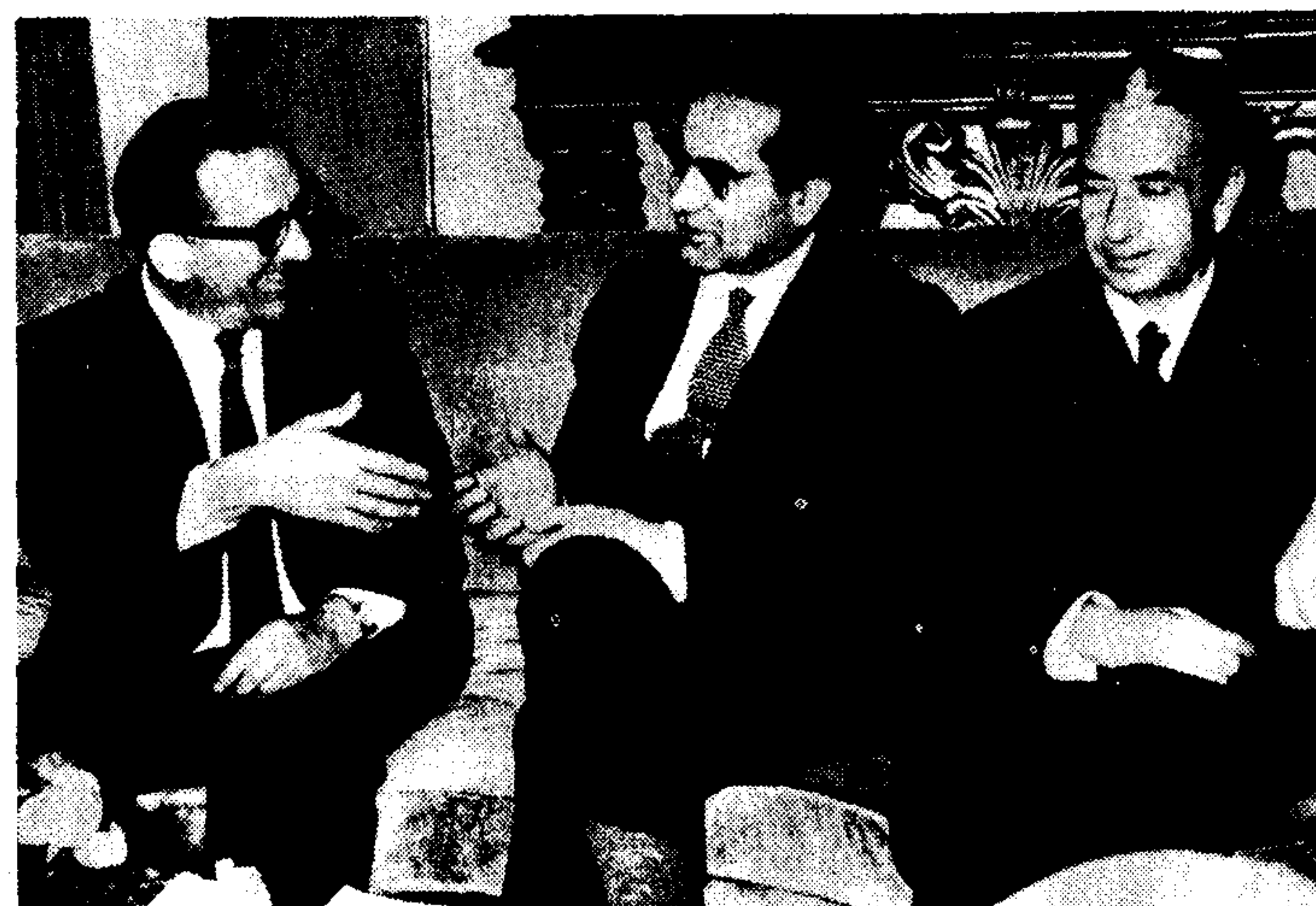
Ο πρωθυπουργός της Μάλτας κ. Μίντοφ (αριστερά) και ο Άγγλος Υπουργός Αμύνης...