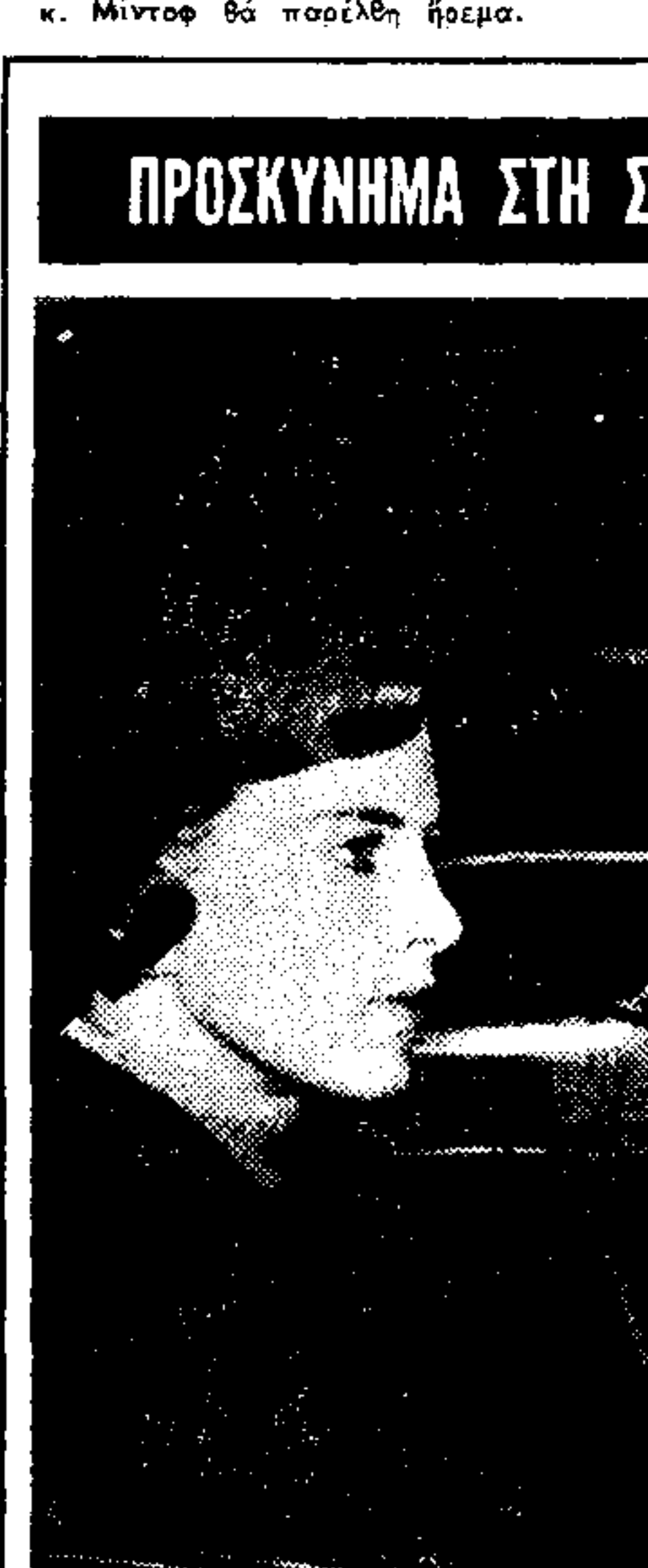
Ο βασιλιάς Κωνσταντίνος της Ελλάδος και η βασίλισσα Άννα Μαρία...

ΑΠΟ ΤΙΣ 25 ΙΑΝΟΥΑΡΙΟΥ. Αρχίζουν τ' έργα στην Κλαυθμώνος για το ΥΠΟΓΕΙΟ ΓΚΑΡΖ.